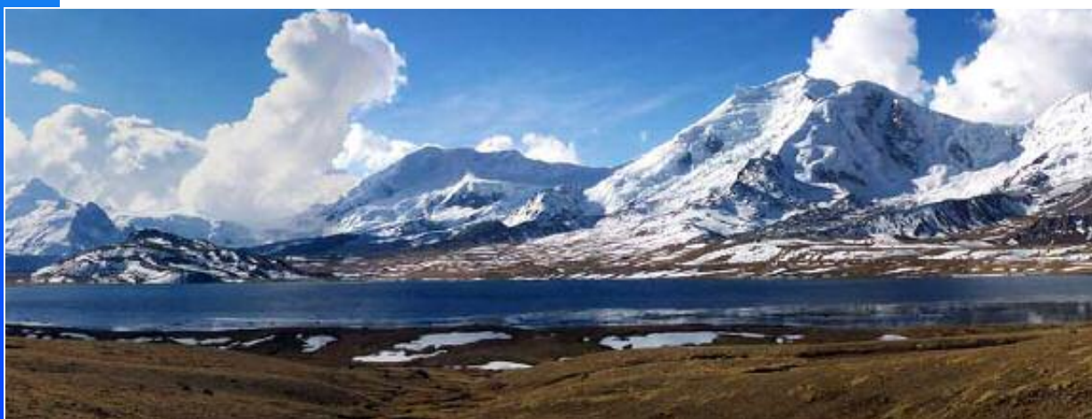
Lagune Ccascana 3500m (camp de base) Province d'Urubamba